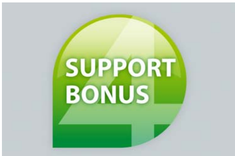
Abb. 01 Signet Support-Bonus